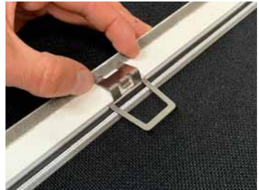
2. Clip platzieren und in Bürstenkanal einhaken.