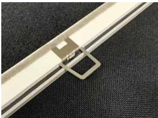
5. Fertig montierter Keder-Clipsgriff.