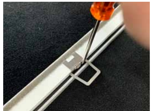
4. Keder vor die Haltenasen schieben. Haltenasen sollen hinter dem Keder liegen.