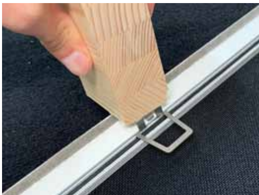
3. Clip einrasten (bei Bedarf Hilfsmittel, z.B. Holzklötz verwenden).